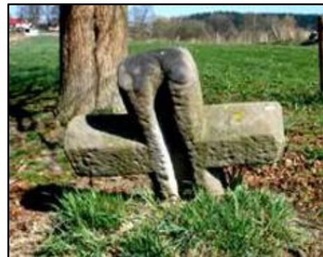
Švédský kříž ve Zdoňově