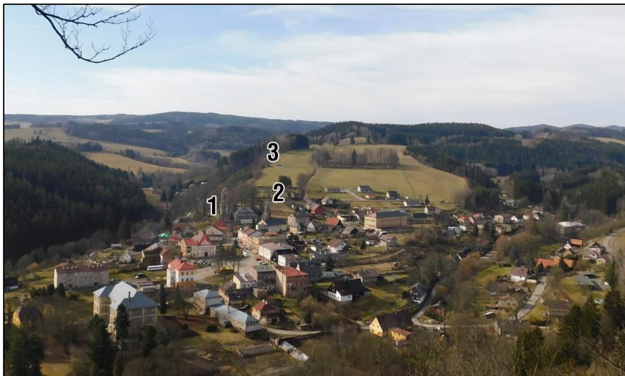
pohled na Stárkov: 1 (kostel svatého Josefa), 2 (hřbitov), 3 (křížová cesta směrem přes les, za lesem je Jívka II., dříve Stará Jívka)