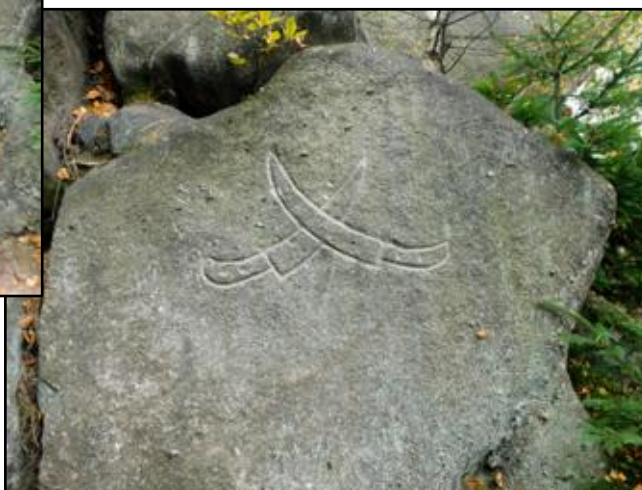
Lotrandova sluj pod Žaltmanem