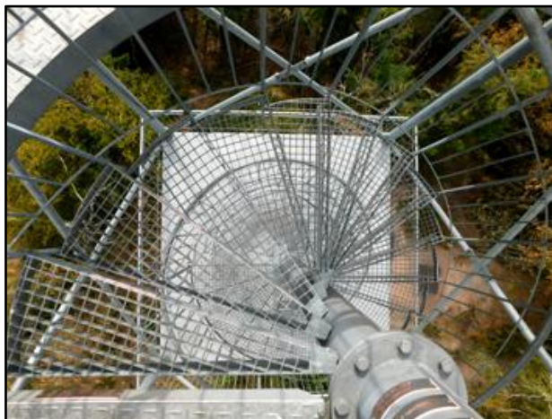
rozhledna Žaltman (2023)