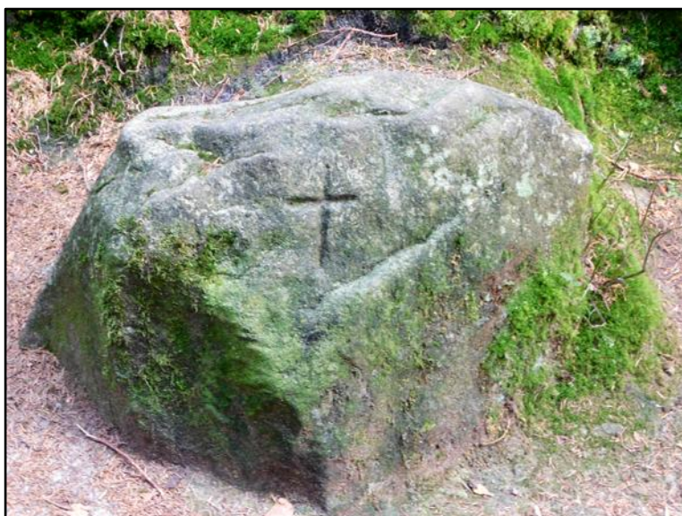
křížový kámen (v nedalekých Teplických skalách)

- Smírčí kříž je kříž kamenný, který bývá nejčastěji postaven na místě, kde se stal hrdelní zločin, kde byl někdo zabit, zavražděn, či došlo ke smrtelné nehodě a neštěstí. Ve středověku bylo totiž možno při trestním stíhání provinilců uplatnit systém takzvaného smírčího práva, kdy byl provinilci uložen trest či úkol, kterým svůj zločin odčinil. Kromě vyrovnání se s postiženou rodinou a pozůstalými, to mohlo být i vytesání a vztyčení kamenného kříže na místě, kde byl zločin spáchán. Pokud nebyl po ruce kameník, který zvládnul vytesat z pískovce či kamene celý kříž, náhražkou bylo vytesání kříže přímo do kamene (skalky), tomuto místu pak říkáme "křížový kámen." Důvodem této úlitby bylo středověké soudnictví, které vycházelo z práva kanonického, tedy náboženského odpuštění na základě lítosti a uznání, že Kristus nás vykoupil z hříchu, a kvůli tomu zemřel na kříži. Odtud tedy pramenil zvyk smíření s pozůstalými přes "smírčí kříž."