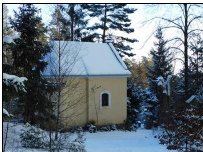
vpravo: Kaple sv. Huberta z roku 1802 (původně zasvěcená Panně Marii Hvězdy Jitřní)