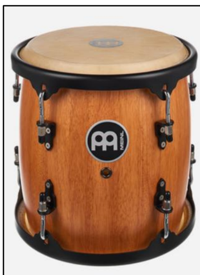
vpravo: Bubínek s názvem Tambora 11", o průměru 11 palců (tedy asi 28 cm) i dnes vyrábí světoznámý výrobce bubňů, firma Meinl