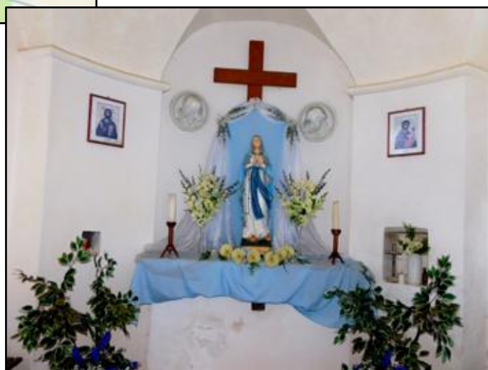
nahoře a vlevo: Kaple Panny Marie Sněžné pod Hvězdou z roku 1709