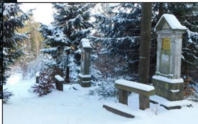
vpravo a níže: Křížová cesta směřující od okraje lesa nad Křinicemi vzhůru ke Kapli sv. Huberta (z roku 1786)