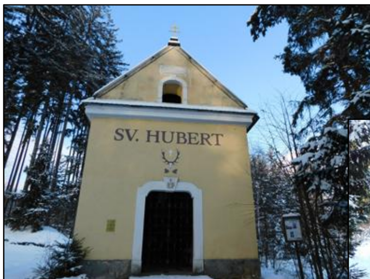
vlevo: Kaple sv. Huberta z roku 1802 (původně zasvěcená Panně Marii Hvězdy Jitřní)