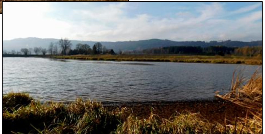
vpravo: Pohled přes rybník Šlégl směrem na Křinice. Na druhé straně rybníka je vidět mezi stromy Schlegelhof, čili Šléglův statek (dnes U Sejkorů / Červený dvůr). Stará cesta na Pasa vedla kdysi za statkem.