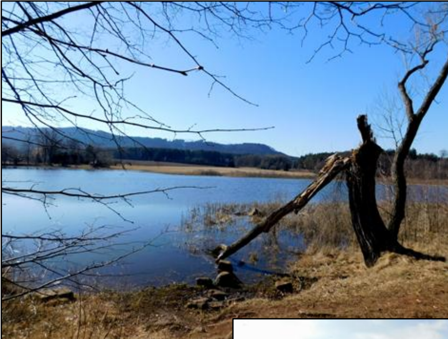
vlevo: Pohled od rybníka Šlégl směrem na Honský špičák (Pasa) na pravém okraji Broumovských stěn (tam vedla ve středověku Stará cesta mezi rybníkem a Honským sedlem)