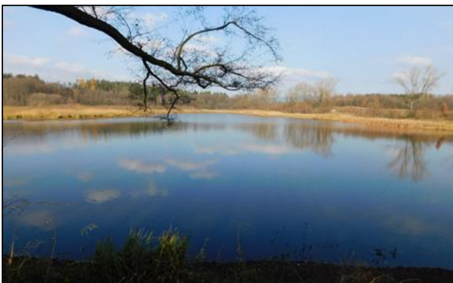
vlevo: Rybník Šlégl (středověký název Hut, čili Klobouček, podle tvaru obráceného klobouku), kde se ve zvrásněných polích (role) hromadila voda, a kam hospodář (Schlegel a další) postupně sváděli vodu z okolních mokřin, aby mohli obdělávat okolní pole a louky