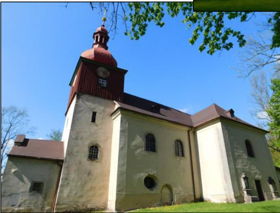
Kostel sv. Máří Magdalény (2021)