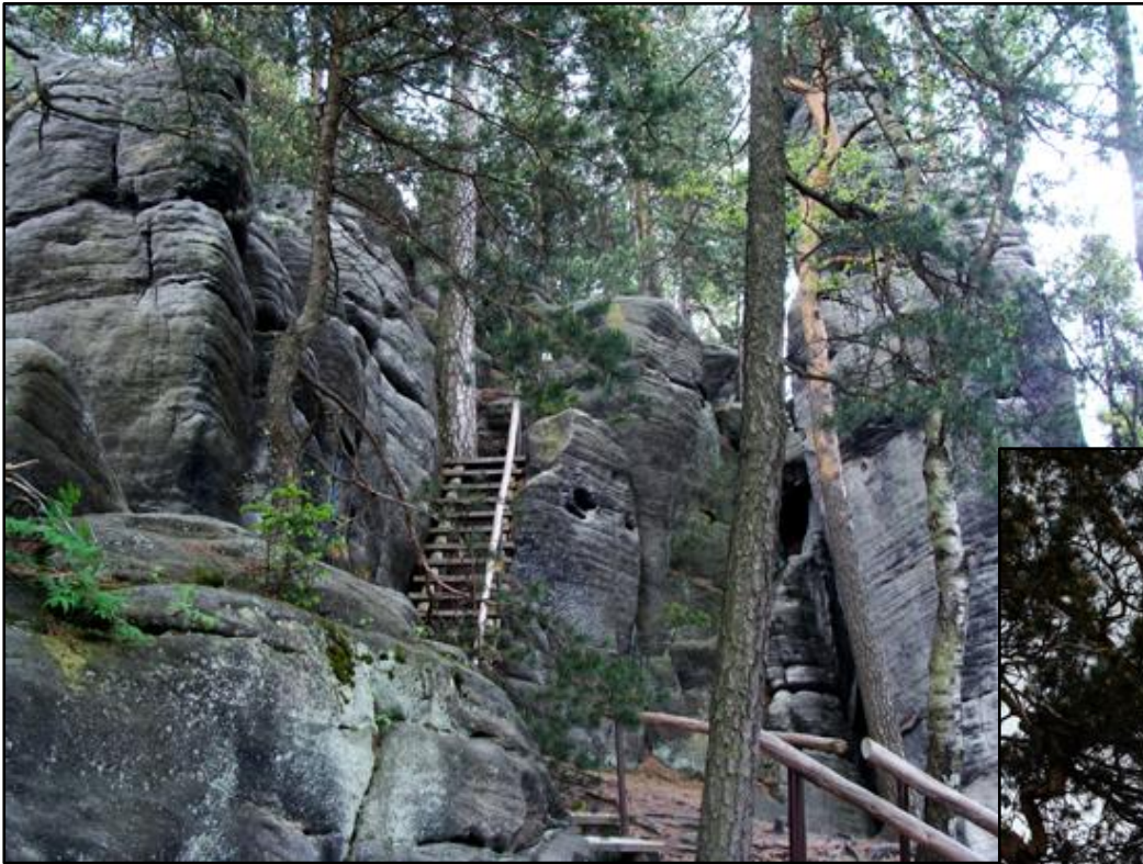
vlevo: Schodišťový výstup vzhůru na Křížový vrch