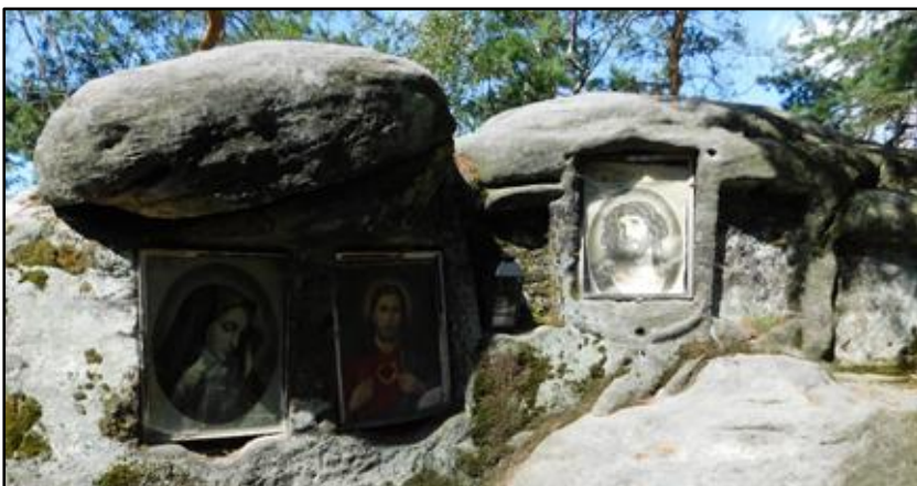
vlevo: Religiózní obrazy těsně pod vrcholem