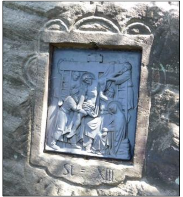
Litinová Křížová cesta zapuštěná do tesaných rámců ve skalním pískovci cestou na vrchol Křížového vrchu