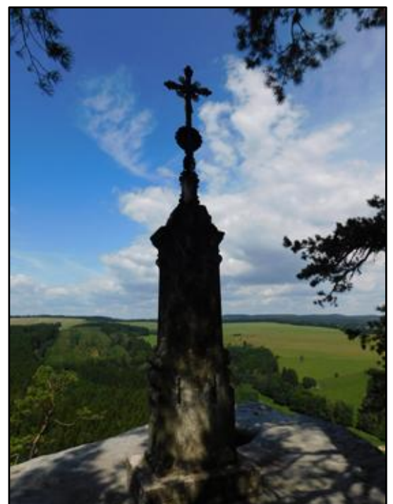
vpravo a níže: Kříž z roku 1857 na vrcholu Křížového vrchu s krásnou vyhlídkou na Krkonoše (přímo) a Adršpašské skály (vlevo)